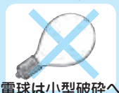
電球は小型破碎へ