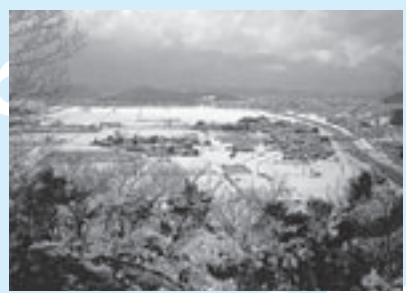
雪の因幡平野（東側より遠望）