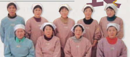
用瀬町食生活改善推進員のみなさん