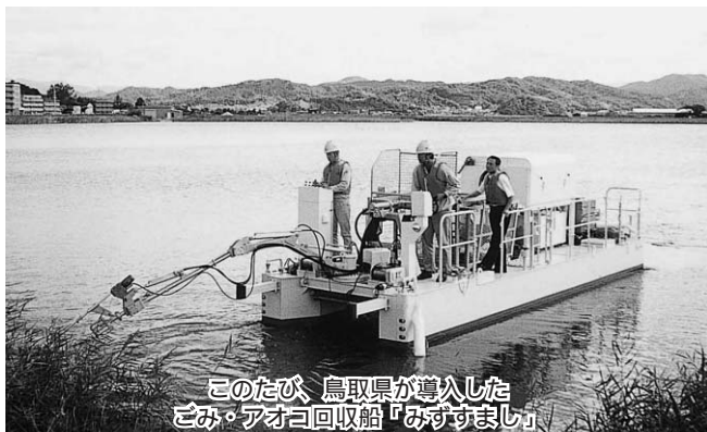
このたび、鳥取県が導入した どみ・アオコ回収船「みずすまし」