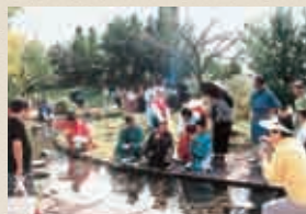
▲昨年の「曲水の宴」の様子

■問い合わせ先 因幡万葉歴史館(国府町町屋726) ☎(0857)26-1780