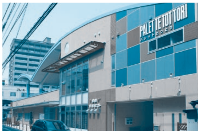
4月8日にオープンした「パレットとっとり」