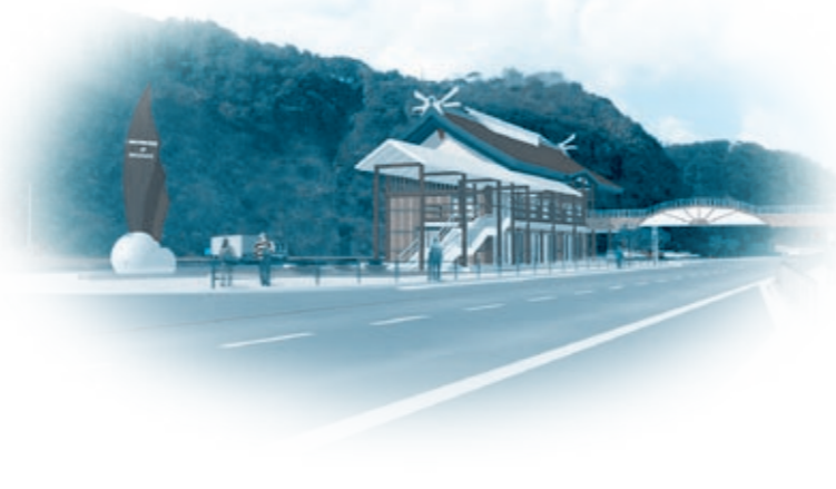
道の駅「白兔の館 (仮称)」のイメージ