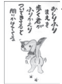
第11回絵たんかの部大賞作品

準大賞1首、入選3首、佳作10首 ▽児童生徒の部／大賞1首、入選3首、佳作10首 ▽絵たんかの部…大賞1首、入選3首、佳作5首 応募・問い合わせ先 国府町総合支所地域振興課(〒680-0197 国府町町屋305-1) ☎(0857)3910555 / ☎(0857)273064