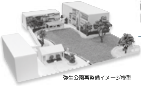
弥生公園再整備イメージ模型

鳥取市では、平成16年3月に「中心市街地活性化基本計画（改訂版）」を策定し、この計画に基づき弥生公園の再整備を行います。