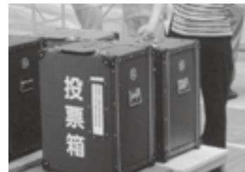
棄権することなく投票しましょう

任期満了にともない、合併後初の市長選挙が4月9日に執行されます。また、11月もしくは12月には、同じく市議会議員選挙が行われる予定です。いずれも今後の鳥取市のまちづくりを進める市民の代表を選ぶ重要な選挙となります。