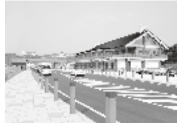
道の駅「神話の里白うさぎ」完成予想図

道の駅「神話の里白うさぎ」は、「因幡の白うさぎ」の神話で全国的にも有名な白兔の国道9号沿いに今春オープンする予定です。ここでは、トイレなどの休憩施設、道路情報や観光情報を提供する情報コーナーを設置するほか、1階に道の駅では珍しい鮮魚の販売も行う特産品販売施設が開店する予定です。また、2階には日本海に沈む夕日や漁火を眺めながら、地元食材を堪能できる和風レストランの営業を予定しています。 道の駅「清流茶屋かわはら」は、千代川の清流と田園に囲まれた自然豊かな河原町高福に今春オープンする予定です。ここでは、地元産品の販売のほか、それらを生かした料理や地酒、陶芸品などを楽しんでいただけます。