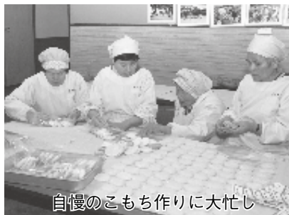
自慢のこもち作りに大忙し

こきびを使用し たもの。そして 上地特産の「ま さき」というヤ マブドウの葉を 摘んで乾燥させ たものを入れた まさき餅は、色 もきれいで上品 な香りと味がす