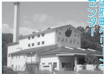
国府町クリーンセンター

■ 場所 福部町筋溪 281-3 ■ 対象地域 福部地域 ■ 処理能力 5ト/8時間 ■ 稼働期限 25年3月