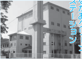
ながさきクリーンステーション

■ 場所 河原町山手 563-50 ■ 対象地域 南部地域 ■ 処理能力 34ト/8時間 ■ 稼働期限 20年6月