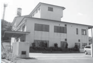
レインボーふくふく

■ 場所 福部町筋溪 281-3 ■ 対象地域 福部地域 ■ 処理能力 5ト/8時間 ■ 稼働期限 25年3月