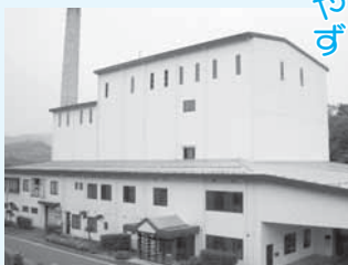
クリーンセンター やす

■ 場所 国府町岡益 464 ■ 対象地域 国府地域 ■ 処理能力 12ト/8時間 ■ 稼働期限 25年3月