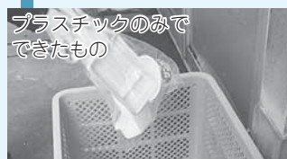
プラスチックのみでできたもの