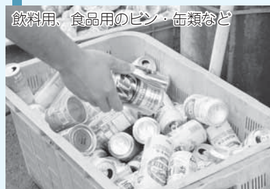
飲料用、食品用のビン・缶類など

▷ビンのキャップやふたは必ずはずして、中を水ですすぎ、袋に入れなくてそのまま出してください。 ※アルミ缶などの缶は、つぶさないでください。割れたピンは小型破砕ごみです。