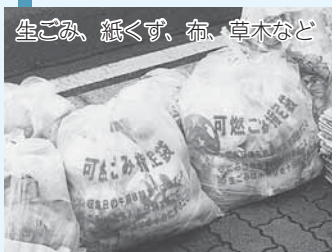
生ごみ、紙くず、布、草木など