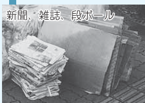
新聞、雑誌、段ボール