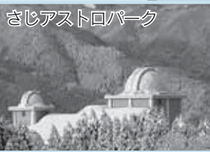
さじアストロパーク