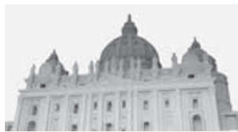
「サンピエトロ大聖堂」