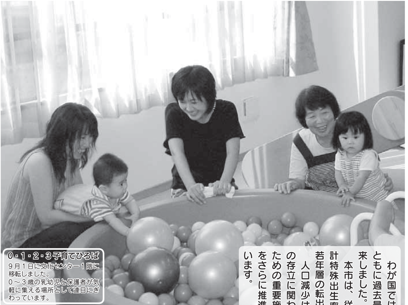
0・1・2・3子育てひろば 9月1日に文化センター1階に移転しました。 0～3歳の乳幼児と保護者が気軽に集える場所として連日にぎわっています。

わが国では、2005年に出生数・合計特殊出生率ともに過去最低を記録し、本格的な人口減少社会が到来しました。 本市は、従来からの子育て支援施策などにより、合計特殊出生率は全国を上回る数値を示していますが、若年層の転出などにより人口は減少傾向にあります。 人口減少は、産業や経済、社会保障など、地域社会の存立に関わる課題であり、本市では人口増加を図るための重要施策の一つとして、「産み育てやすいまち」をさらに推進するための子育て支援事業に取り組んでいます。