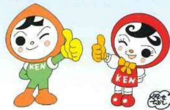
人権イメージキャラクター 人KENまもる君・人KENあゆみちゃん

この冊子には、音声コードが印刷されています。専用の読み上げ装置で読み取ると、音声で聞くことができます。