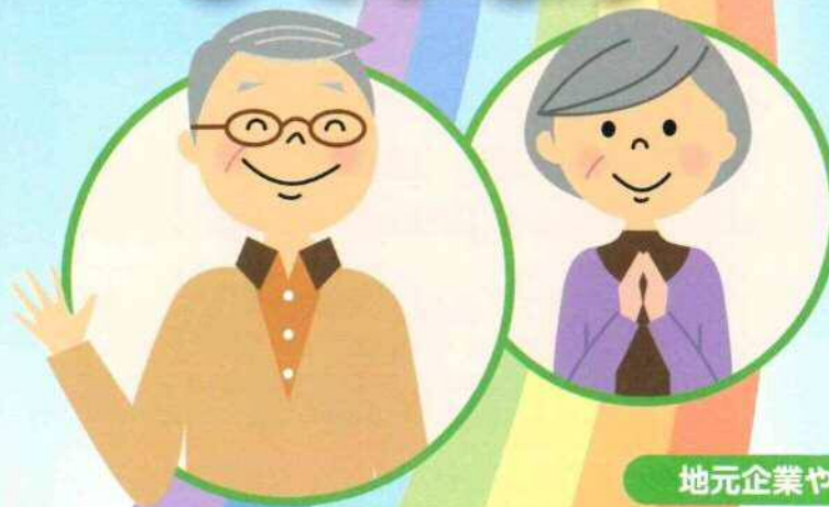
人権イメージキャラクター 人KENまもる君・人KENあゆみちゃん