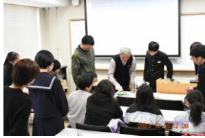
12月5日鳥取大学で科学実験観察