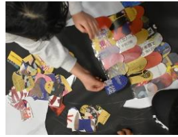
12月12日県立博物館「アート出前」