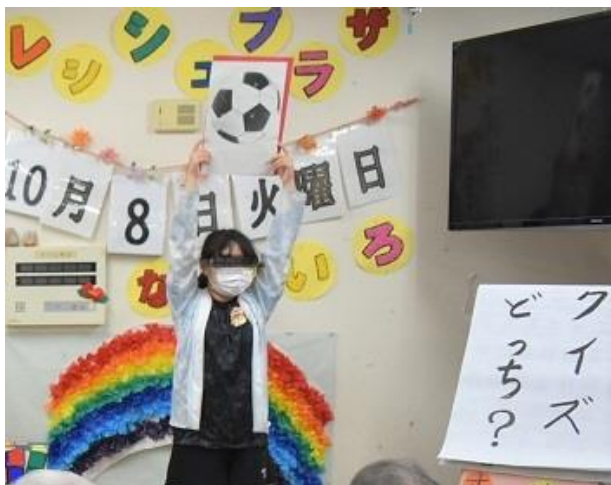
こちらは人気のプログラム「二択クイズ」です。会場は今年も大変盛り上がりました。