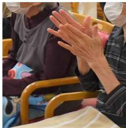
たくさんの拍手をいただき、ありがとうございました。