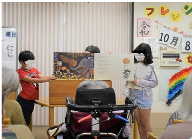
大型絵本「ぐるんぱのようちえん」の読み聞かせです。

なないろデイサービスセンターを訪問し、利用者の方と交流を行いました。その時の様子を御紹介します。