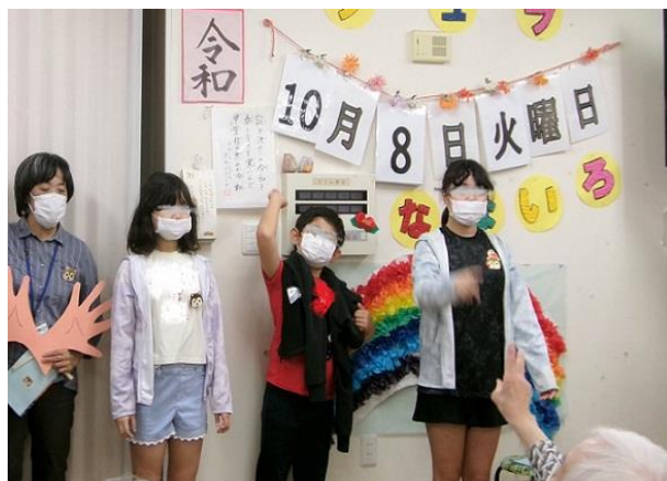
今年の手話歌は「にじ」を披露しました。