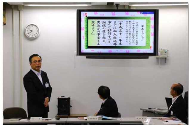
「市長ミッション」で若手職員による政策提案を促進