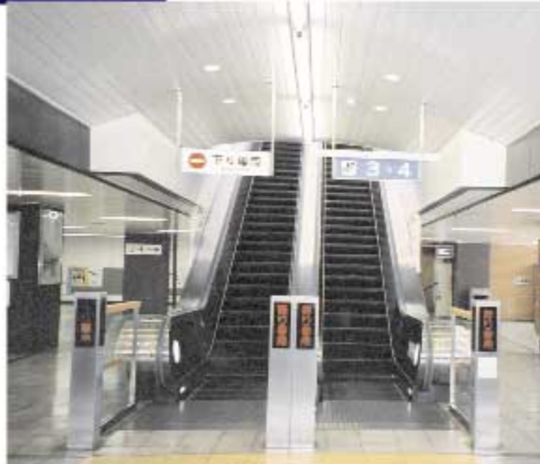
車いす対応型エスカレーター