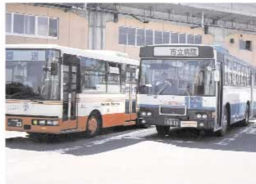
車いす対応型ノンステップバス