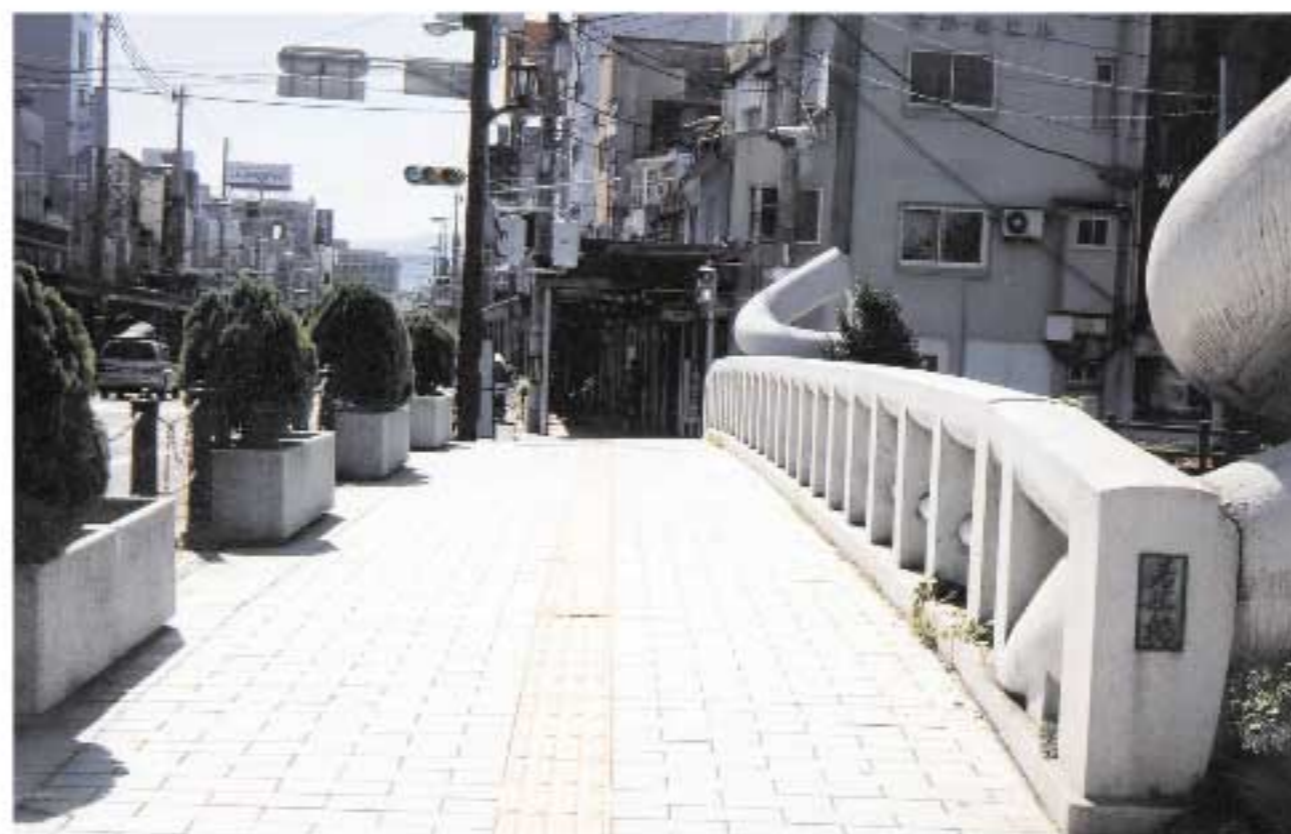
融雪装置付きの橋（国道53号線・若桜橋）

本市では、高齢者・身体に障害のある方々にご協力いただき、福祉のまちづくり施策によって随時歩道の段差解消などの取り組みによって市内中心部などでは基本的なバリアフリー空間は形成されつつあります。しかし、高齢者・身体に障害のある人にとっては依然利用に不便な乗り物・施設・道路等があり、今後はそうした利用者の率直な意見を参考に、現在の本市にとって必要性の高い、実効性のある交通バリアの解消に取り組む必要があります。