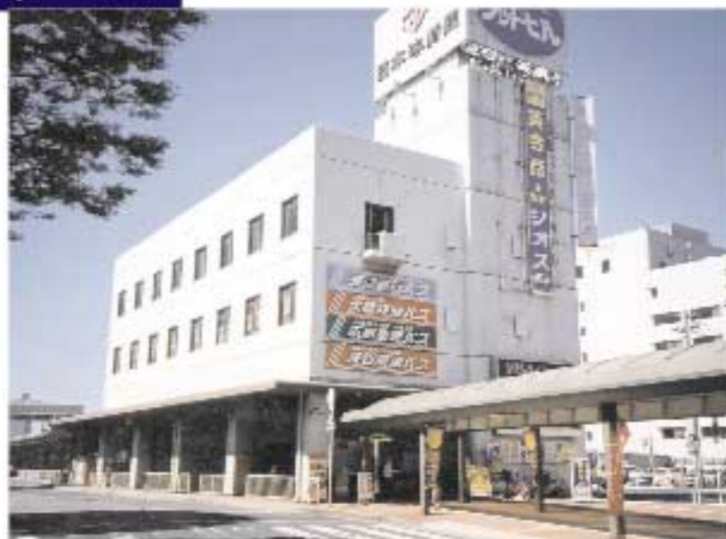
鳥取バスターミナル