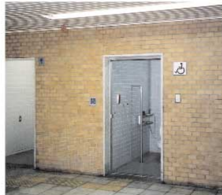
障害者用トイレ（1階）