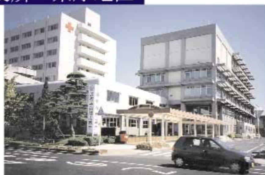
鳥取市役所と鳥取赤十字病院(左)