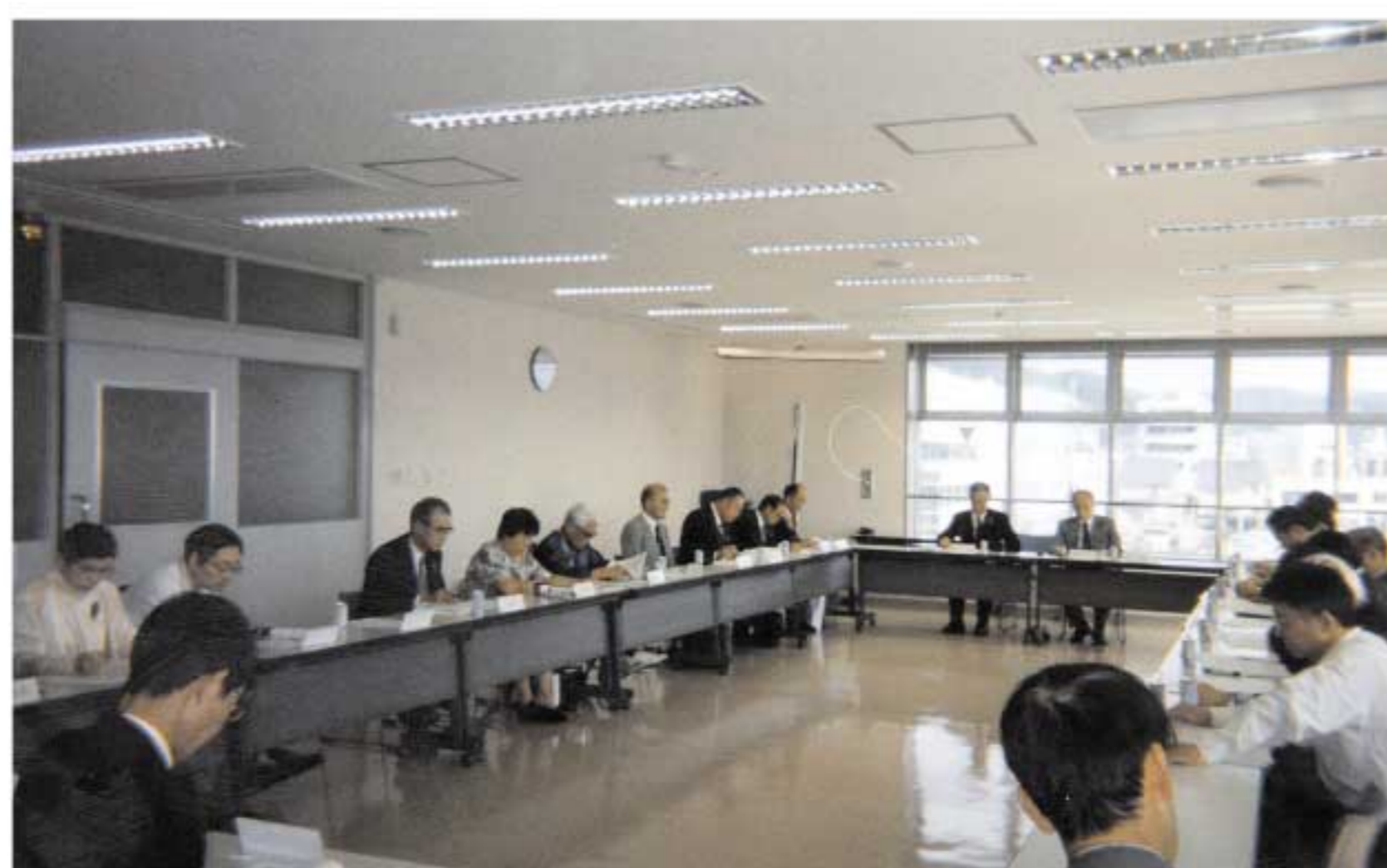
活発に意見交換が行われる委員会