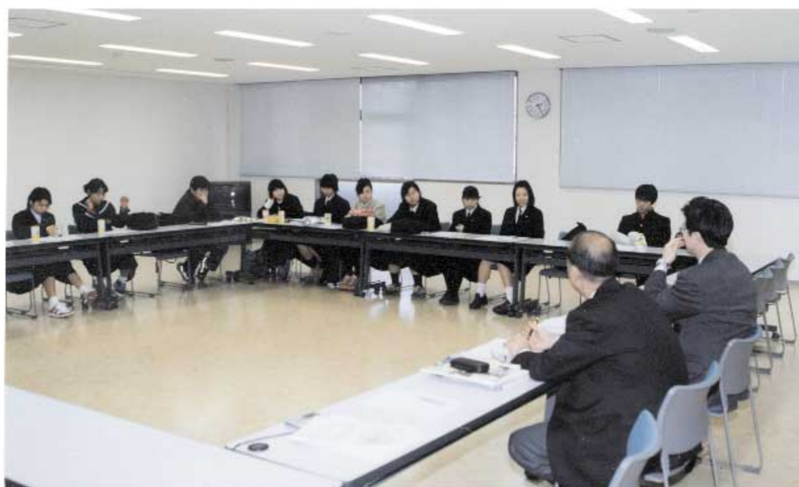
福祉MAPづくり隊との熱心な意見交換

ポイント 福祉MAPの作成を通じて、鳥取市中心部のバリアフリーについて詳細な情報と体験をもつ福祉MAPづくり隊のみなさんに、現時点での忌憚のない意見を聴取する。