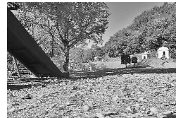
「落ち葉吹く秋うらら」