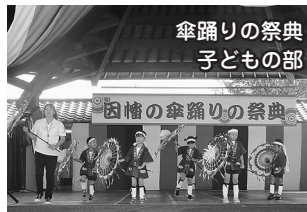
傘踊りの祭典 子どもの部