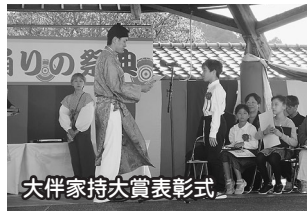
大伴家持大賞表彰式