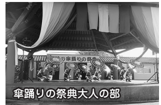
傘踊りの祭典大人の部