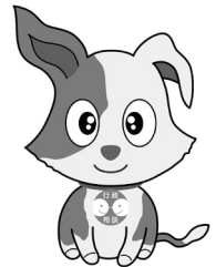
総務省行政相談センター