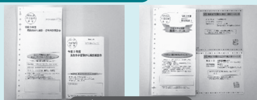
がん検診の受診券