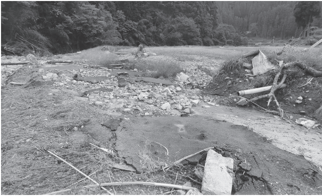
台風による土砂が流れこんだ余戸地内の農地

内閣府は、10月6日に令和5年8月12日から同月17日までの間(台風第7号)の暴風雨による災害について、地方公共団体や関係省庁等による被害状況調査の結果、「激甚災害に対処するための特別の財政援助等に関する法律」に基づき、激甚災害として指定し、併せて当該災害に対する適用措置を指定することを決定しました。