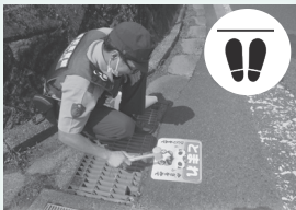
歩行者ストップマークの設置作業

鳥取市交通安全対策協議会佐治地区会では、秋の全国交通安全運動の取組として、福園交差点に歩行者ストップマークを設置しました。歩行者自身も自らの身を守る行動を取りましょう。