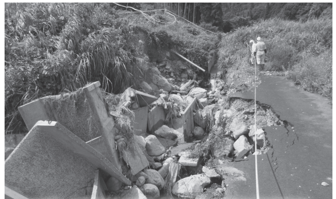
被災した農業用施設の被害状況を調査する関係者