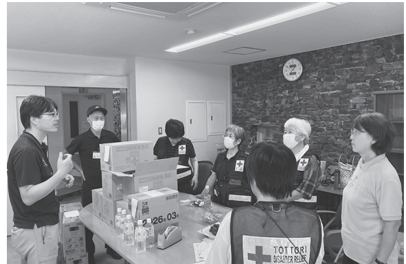
日赤鳥取県支部や支所と支援物資の調整を行う佐治町赤十字奉仕団

有時での団の必要性を再認識するとともに、団が今後も住民とともにありながら、佐治町になくはない団体の一つとして楽しく活動を続けていきたいと考えています。