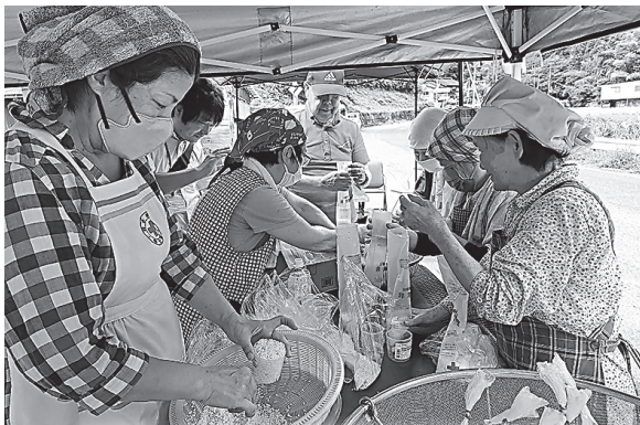
災害後、中集落での奉仕団による炊き出し風景