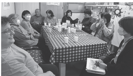
「ローリーママの地域食堂」で談笑する参加者

佐治町尾際の福安商店を会場に、佐治町で2か所目の地域食堂である「ローリーママの地域食堂」が開設されました。大人200円、子ども無料の特性カレーを食べながら会話が花が咲き、カラオケも楽しみました。当日集まった人は、食事をしながら人間関係の大切さや人の繋がりの温かさを感じていました。