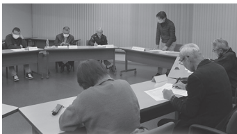
新しく組織された実行委員会

災害を乗り越え、地域で必要と思われる災害関連の取組を地域が一体となって考え、災害に強い地域づくりを目指すため、町内の団体から組織された「災害に強い佐治町創り事業実行委員会」により、今年の1～3月に①アンケート調査②先進事例調査③災害に強い地域を考える集いが実施されることになりました。詳しくは、市報1月号に折込しています「災害に強い佐治町創り事業」の取組についてのチラシをご覧ください。