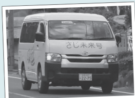
全て予約となったさじ未来号

さじ未来号の運行について、利用状況などを踏まえ、利用者の利便性の維持、向上及び運行の適正化の観点から見直しが行われました。見直し後は、毎日全て予約での運行とされ、利用には必ず事前予約が必要のため予約受付のルールも定められました。