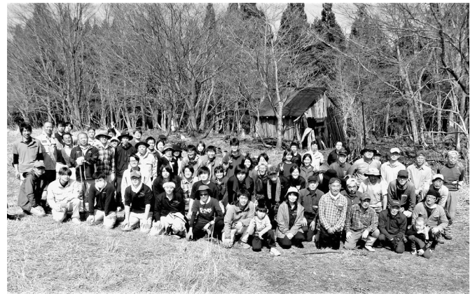
三原台地で作業にあたっていただいた参加者

余戸地内にある標高900mの三原台地は、以前絶滅危惧種の蝶「ウスイロヒョウモンモドキ」が飛び交う草原でした。そして、この蝶の特徴として、比較的規模の大きい半自然のススキ草原に生息し、草刈りによる人為的な維持が必要とされているところです。しかしながら、最近山に入り、ススキ刈りなどの草原の手入れを行うこともままならない中、幼虫の餌とする食草オミナエシが鹿の食害に遇っていることもあり、現在この三原台地では蝶の生息が確認できていない状況でした。