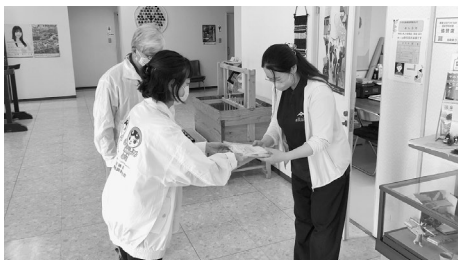
人権擁護委員による事業所訪問の様子

いじめ、差別、虐待など人権に関して、あなた の街の相談パートナーとして活動している人権 擁護委員では、6月1日の「人権擁護委員の日」に 合わせて人権啓発に取り組んでいます。佐治町 内では、町内11ヶ所の事業所を訪問し、チラシ の配布とともに人権啓発の呼び掛けを行いました。