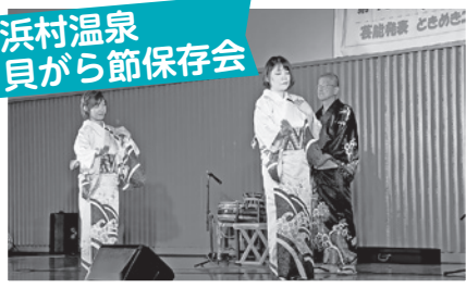
浜村温泉貝がら節保存会