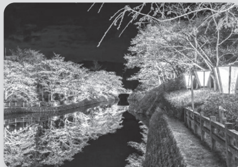
鹿野城跡公園の桜開花状況も随時お知らせする予定です。