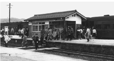
昭和30年代 にぎわい青谷駅ホーム

今年、日本初の鉄道が1872年(明治5年)10月に「新橋～横浜間」で開業してから150周年を迎えます。そして、1912年(明治45年)3月に山陰本線「京都～出雲今市(現出雲市)間」が開業してから110周年となります。