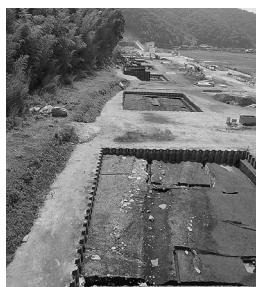
①道路遺構(北西から)