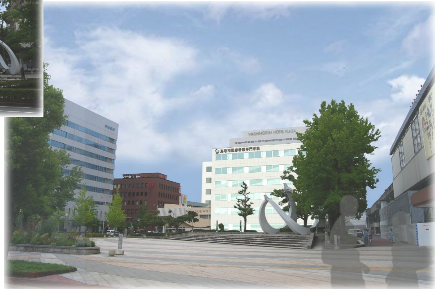
J R 駅前広場よりみる