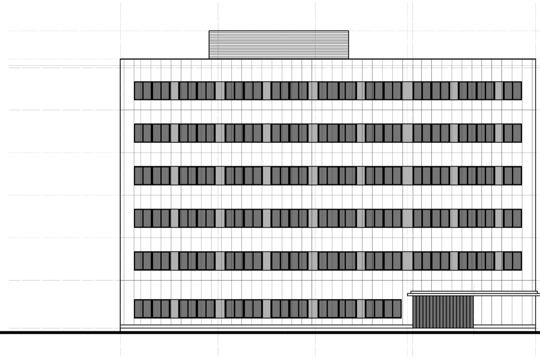
東立面図 S = 1 / 200