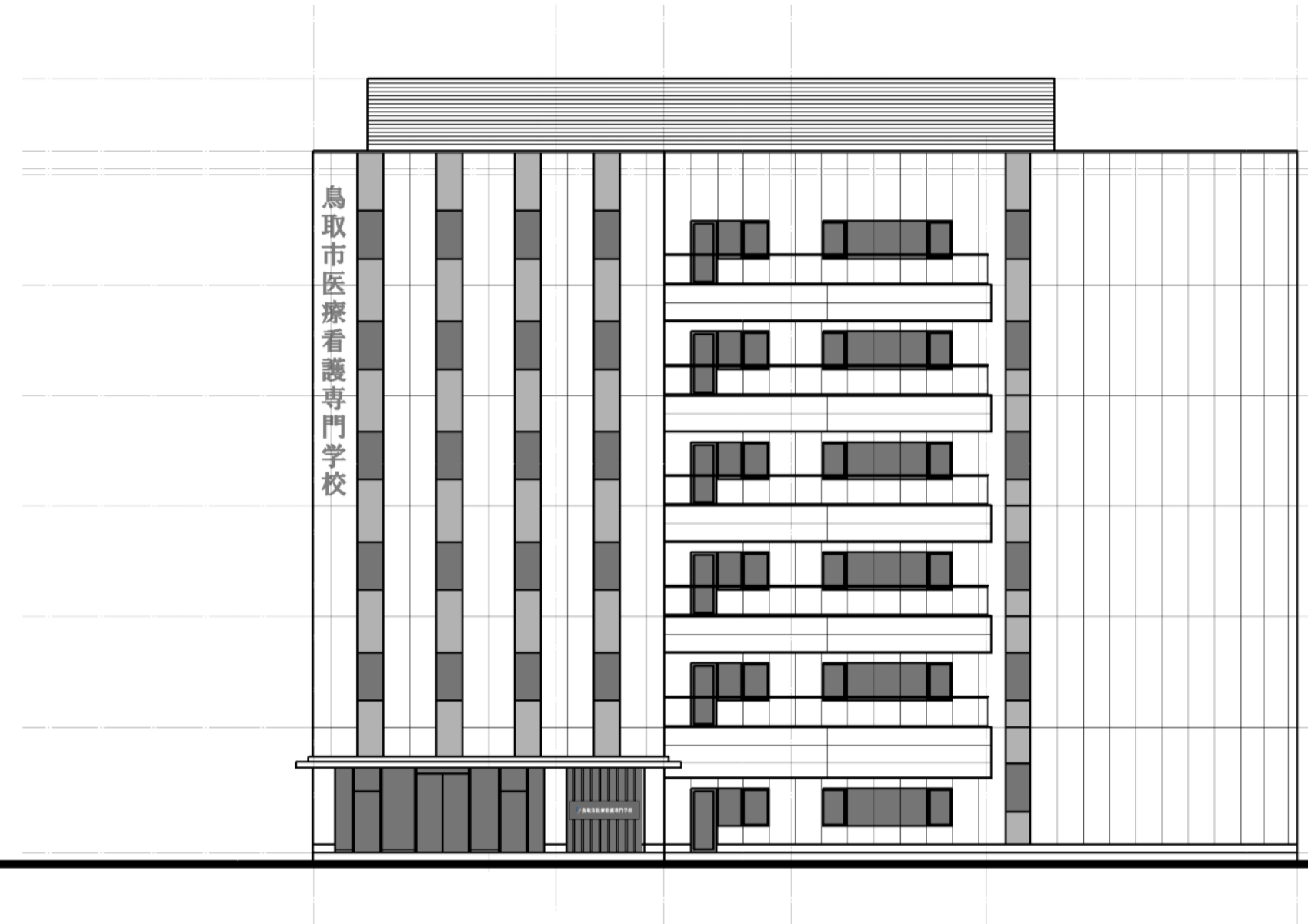
北立面図 S = 1 / 200