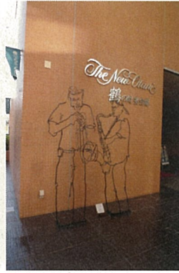
ホテルニューオータニ別館入り口