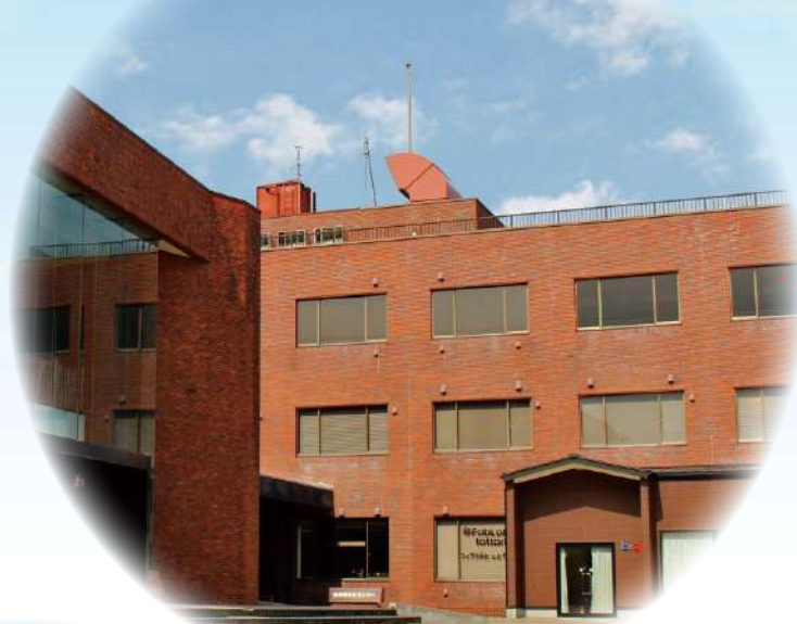
鳥取市文化センター