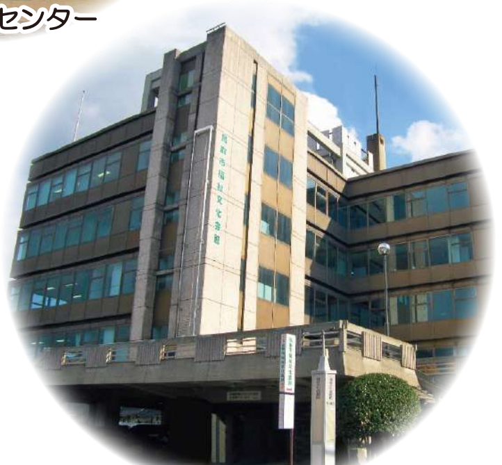
鳥取市福祉文化会館 (鳥取市文化センターサテライトオフィス)