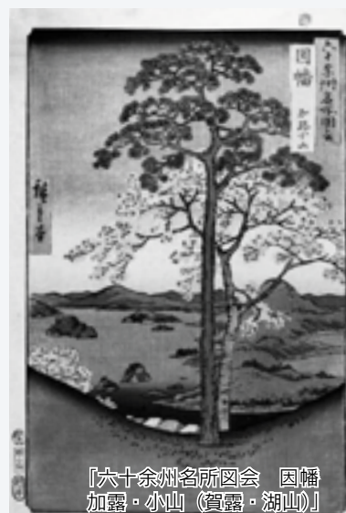
『六十余州名所図会 因幡加露・小山(寶露・湖山)』

また、展示した資料の大部分は『館蔵品選集Ⅰ』として図録にして発行します。鳥取の数々の郷土資料がピジュアルなカタログになったものはあ