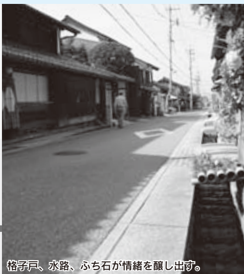
格子戸、水路、ふち石が情緒を醸し出す。