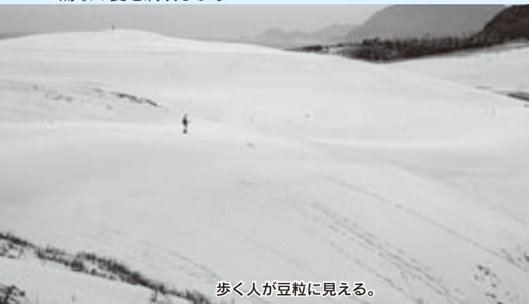
歩く人が豆粒に見える。