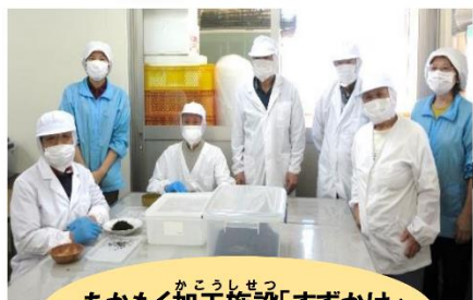
あかもく加工施設「すずかけ」 のみなさん

鳥取県産のあかもくを使っているので、地産地消になります。たくさん食べて鳥取の味を味わってください!