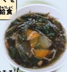
あかもくのみそ汁