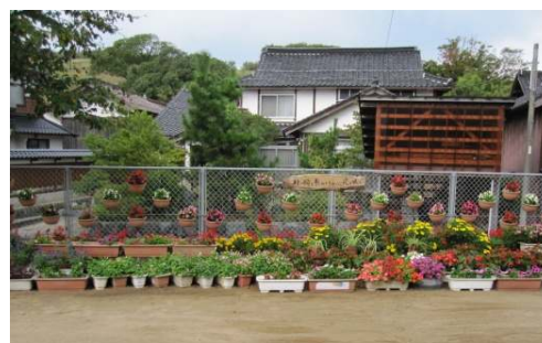
最優秀賞 細川集落の作品