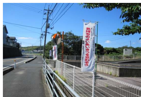
幼稚園フェンスに設置の幟

通学路である県道福部停車場線を、国道9号県交差点から福部駅までを「あいさつロード」と定め、毎月1日から7日まで幟を設置して、あいさつ運動の啓発を行っています。