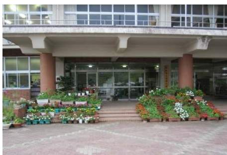
優良賞 小学校の作品