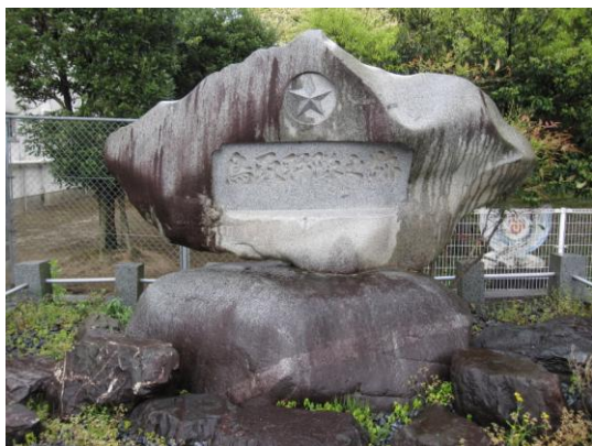
鳥取四十連隊跡碑