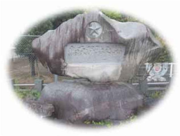
鳥取四十連隊跡碑