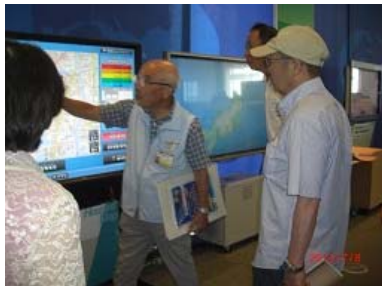
(神戸 防災センターにて防災研修)

各町内会での防災組織づくり(行政と町内会との協働) 現在の市の防災体制調査(行政と各種団体との協働) 各家庭に災害未然防止を周知(町内会・各種団体) 各町内に避難場所の看板設置(行政・町内会) 各町内で防災、避難訓練の実施(行政・町内会・各種団体) 高齢者・要援護者の把握(町内会・各種団体)