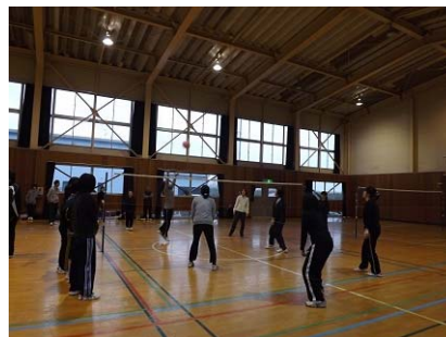
(地区ソフトバレーボール大会)