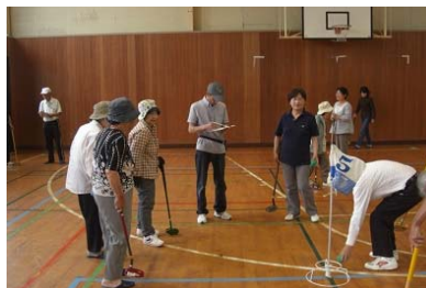
（グラウンドゴルフ大会）