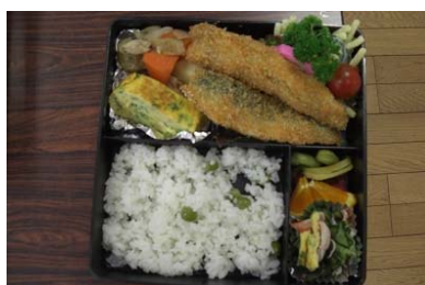
（できあがったお弁当）