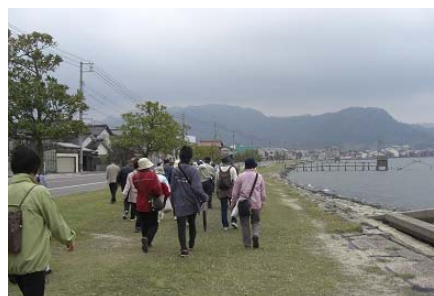
(歩け歩け健康づくり 準備体操 ・ 東郷湖 湖畔ウォーキング)