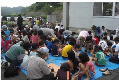
（そうめん流し・箸と器づくり）

高齢者と子どもとの交流（社協・老人クラブ・公民館） 高齢者の生きがいの場づくり・グラウンドゴルフ大会など