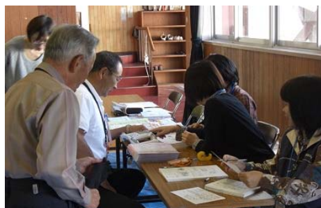
(文化祭での健康相談)

健康診断の充実と制度の普及（行政との協働） 健康づくりのきっかけづくり【各種スポーツ大会】(各種団体)