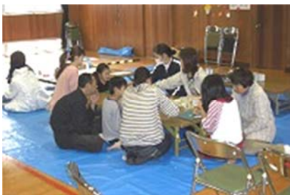
（子ども創作コーナー）