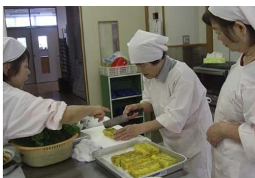
（配食サービスの様子）