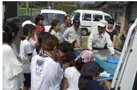
（山白川の生態系調査）