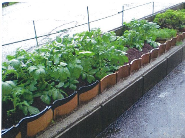
「じゃがいもを植えよう！」の情景です。