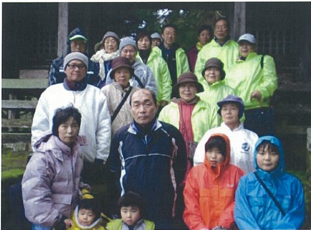
健康ウオーキングの情景です。