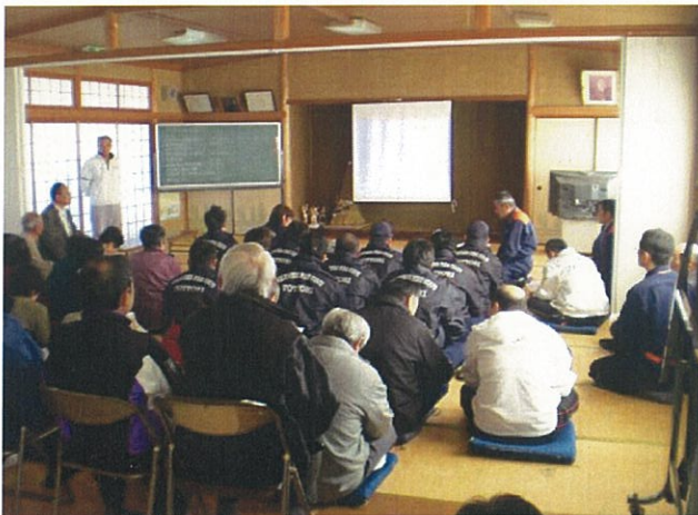
気高広域消防署の職員より火災報知器の諸説明を受けている情景です。