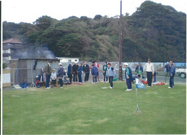
グランドゴルフの情景です。