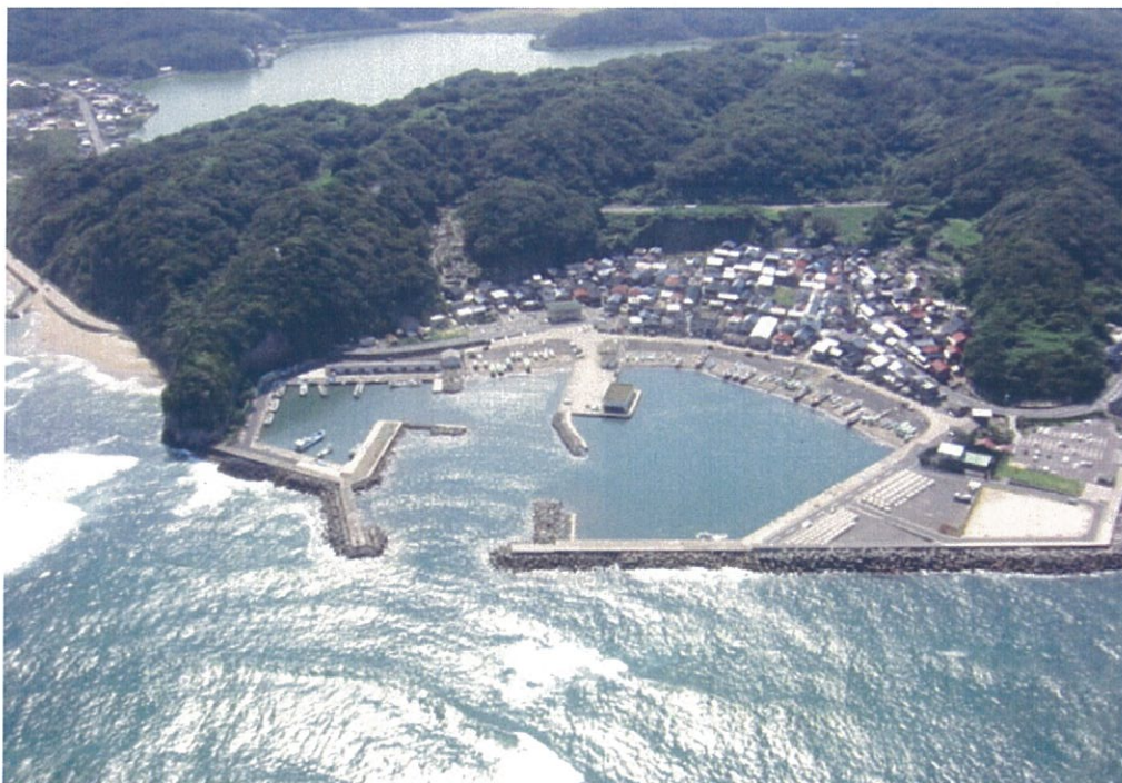
酒津を上空から見た景観です。

地域住民の相互のふれあい、協力で一步一步、推進し、将来の酒津のあるべき姿づくりをめざします。