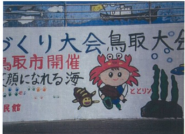
西側の岸壁に描いた絵です。(酒津 固有の行事です)