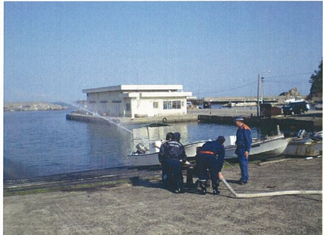
気高広域消防署の職員より消火訓練の指導を受けている情景です。