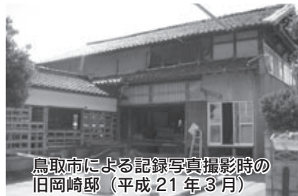
鳥取市による記録写真撮影時の 旧岡崎邸（平成21年3月）

旧岡崎邸に ついては、鳥 取市文化財審 議会での協議し た結果、「文化 財指定には至 らない」という結論が出ています。 また、本年6月定例市議会に「旧岡 崎邸の現地保存についての陳情」が 提出されましたが、常任委員会が審 査された結果、不採択となりました。