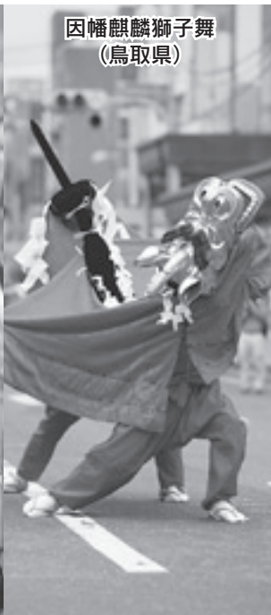
因幡麒麟獅子舞 (鳥取県)