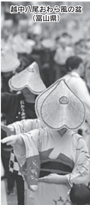
越中八尾おわら風の盆 (富山県)