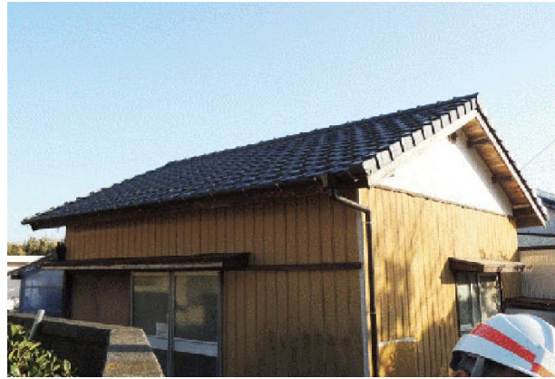
ガイドライン工法の瓦屋根（ほとんど被害なし）