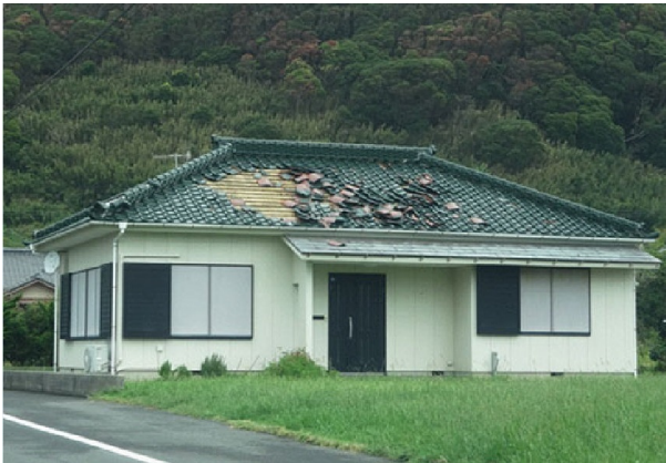
非ガイドライン工法の瓦屋根（瓦が脱落）

鳥取市は、国・県と協調し、屋根の耐風性能が十分でない住宅の屋根瓦が、強風時に周囲の建築物に被害を及ぼすことを未然に防止するために、屋根瓦の改修（屋根瓦耐風対策工事）を行う所有者に対して費用の一部を助成します。