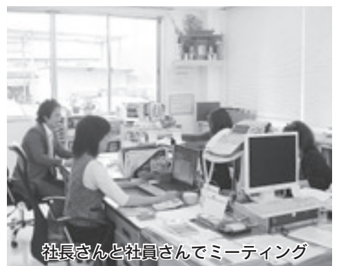
社長さんと社員さんでミーティング