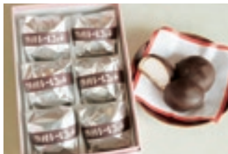
チョコレート饅頭6個入り

「とっとり市報」へのご意見、ご感想をお寄せください。 抽選で5名様にプレゼントします。