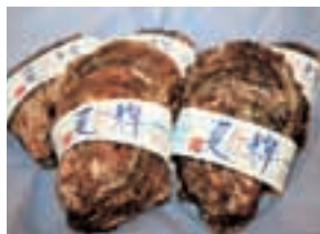
岩ガキ5個、カキナイフ、軍手、さばき方・料理方法チラシのセット

「とっとり市報」へのご意見、ご感想をお寄せください。 抽選で5名様にプレゼントします。